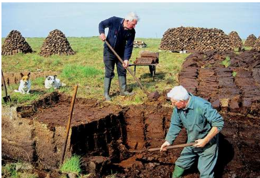
Foto di repertorio sull'estrazione di torba in Irlanda

E' una sostanza organica fossile, ricca di carbonio derivata dalla decomposizione di sfagni e muschi in zone paludose contenente una certa quantità di terra. Può essere acida se il pH è inferiore a 5 e la sostanza organica è almeno l'80% sul secco; neutra se il pH è maggiore di 5 e la sostanza organica è almeno il 40% sul secco. Possono contenere dall'1,5 al 3,5% di azoto, dallo 0,1% massimo di fosforo e potassio. Siccome il loro costo è alto conviene adoperarle solo su colture ad alto reddito. Sui sacchetti del commercio in etichetta sono riportate le caratteristiche; per l'uso in agricoltura biologica ne deve essere riportato esplicitamente l'autorizzazione ed il dosaggio.